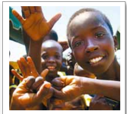
SÅNG, DANS OCH TRUMSPEL.