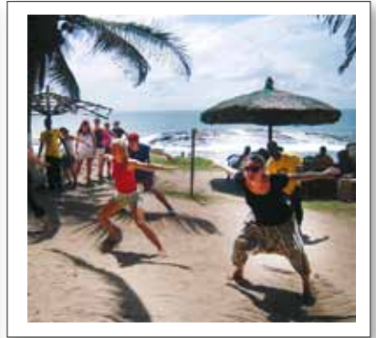
TIKVA OCH DANS VID HAVET.